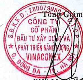
PHẠM BẢO LONG