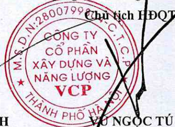
VU NGỌC TÚ